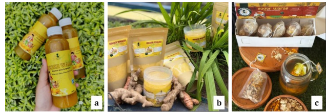
Gambar 5. Minuman Rempah Siap Saji (a), Serbuk (b) dan Minuman Rempah Celup (c)

Melalui kegiatan ini, berhasil dihasilkan tiga produk diversifikasi minuman herbal berbasis rimpang, yaitu dalam bentuk siap saji, serbuk instan tanpa ampas, dan celup (Gambar 5). Ke depan, mitra diharapkan mampu mengoptimalkan potensi tersebut dengan mengembangkan berbagai produk turunan lainnya, seperti jahe bubuk, kunyit bubuk, maupun varian rimpang celup.