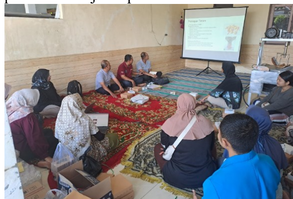
Gambar 1. Dokumentasi Pelatihan Diversifikasi Minuman Rempah Fungsional

Rangkaian kegiatan pengabdian diawali dengan pre-test untuk mengukur kondisi awal pengetahuan mitra terkait diversifikasi produk. Selanjutnya, tim pengabdian menyampaikan materi mengenai peluang pengembangan produk minuman herbal berbasis rimpang serta memberikan pelatihan teknis. Materi pelatihan mencakup teknik pembuatan minuman herbal berbentuk serbuk tanpa ampas melalui metode kristalisasi dan teknik pembuatan minuman herbal celup. Kegiatan ini diikuti oleh anggota KWT dengan antusias, peserta juga aktif bertanya dan memberikan pendapat saat sesi diskusi berlangsung. Dokumentasi kegiatan pelatihan disajikan pada Gambar 1.