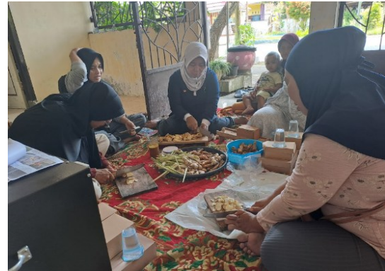
Gambar 3. Dokumentasi Pendampingan Produksi Minuman Rempah Celup

yang sudah kering kemudian didinginkan, dan dilakukan formulasi jahe, lengkuas, dan sereh, dengan perbandingan berat kering 1:1:1:2. Ramuan rimpang dibungkus dalam tea bag dan dikemas dengan box.