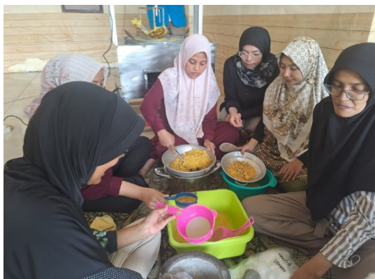
Gambar 2. Dokumentasi Pendampingan Produksi Minuman Rempah Serbuk

Pembuatan minuman rempah serbuk instan tanpa ampas dengan menerapkan metode kristalisasi. Teknik ini cukup sederhana, yaitu dengan menambahkan gula pada sari rimpang [12]–[14]. Bahan yang digunakan yaitu kunyit, jahe, sereh, dan lengkuas, yang dihaluskan dan diambil sari patinya. Cairan ini kemudian dimasak dan diaduk secara terus menerus hingga mendidih. Setelah itu, api dimatikan, dan proses pengadukan dilanjutkan sampai ramuan berubah menjadi serbuk. Tahap akhir adalah pengayakan untuk menyeragamkan ukuran bulir serbuk (Gambar 2).